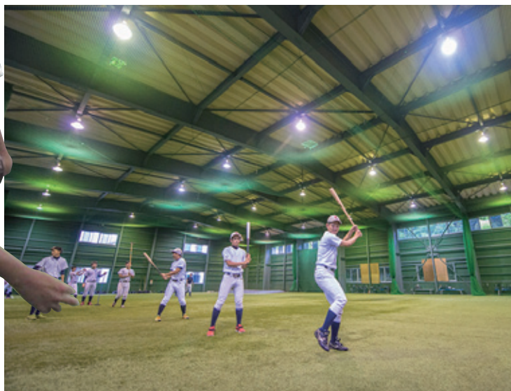
屋内練習場 雨天時、冬期間に使用。4カ所での打撃練習と3人同時に投球練習を行うことができます。