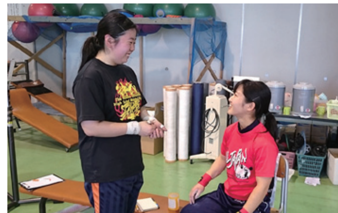
練習前のポイント確認