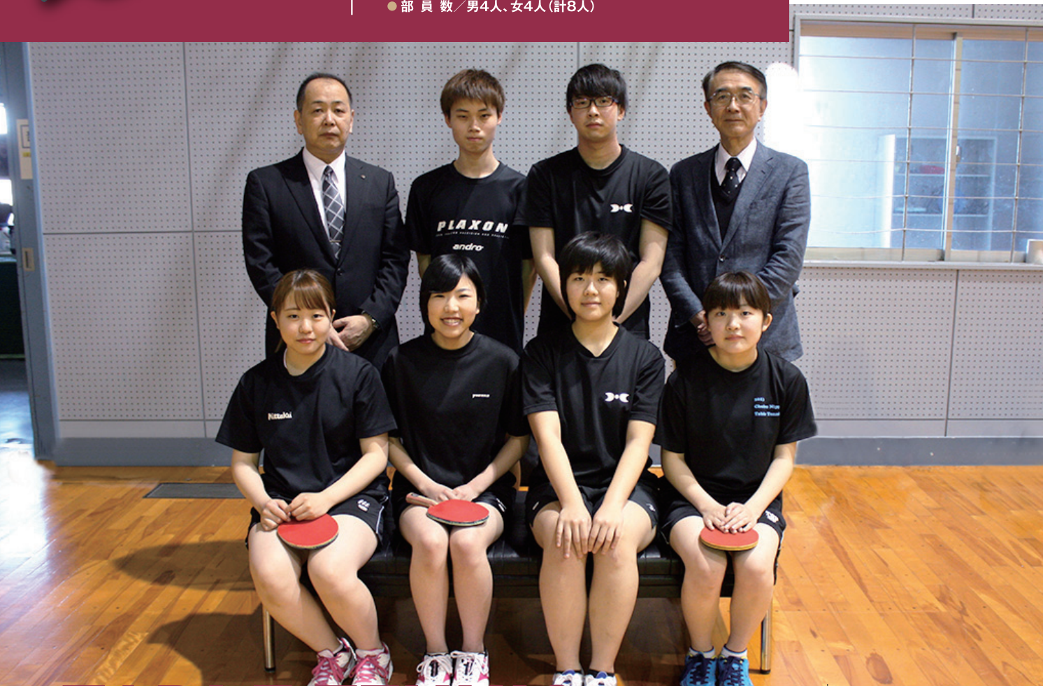
TABLE TENNIS H30年4月から本格始動 一人一人がゼロからのスタート

同好会として活動を続け、平成30年4月よりクラブとして創部し、本格的な活動をはじめたばかりですが、男女アベックで全日本学生選手権出場を目指して頑張っています。競技者として頑張りたい人、サークル活動として参加したい人、色々な思いを持った卓球好きな人が集まり個々のスキルアップを目指していきます。